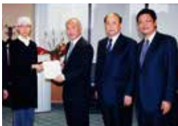
舛添大臣に対し、抗がん剤の未承認薬問題について陳情。

4 県道小城・富士線上の北浦区間（長崎自動車道下から温泉橋まで）は現道拡幅工事とし早期に事業認可を求めます。