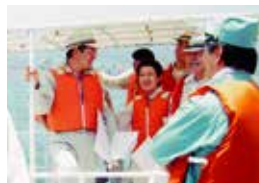
諫早湾干拓潮受堤防視察の途中で。

5 県道小城・杉山線の親水公園から岩松小学校までの間の道路改良事業を実施します。